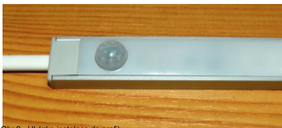
Obr.2 - Ukázka instalace do profilu

Po nastavení požadované hodnoty potvrdíte změnu současným stisknutím obou tlačítek, změna se uloží a LED krátce stroboskopicky zablikají na znamení, že režim nastavení byl ukončen a senzor se přepne zpět do pracovního režimu.